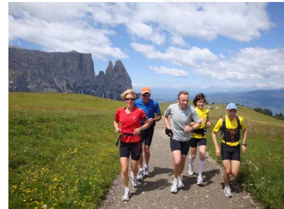
Nach dem grossen Erfolg im 2011

Europas grösste Hochalm....56 Quadratkilometer, zwischen 1 800 und 2 300 m